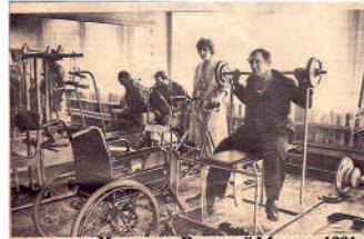
Из газеты «Вечерний Минск», 1991 г.