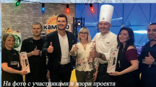
На фото с участниками и жюри проекта

Если Вы творческий человек и готовы поделиться своим талантом, мы готовы предоставить такую возможность на страницах нашего издания. Приглашаем авторов к сотрудничеству.