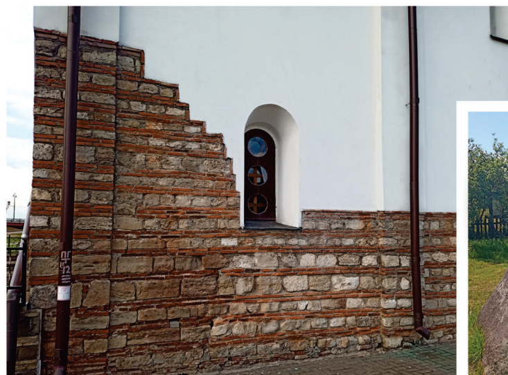
Храм был снесен во времена Н.С. Хрущева и восстановлен в постсоветское время, но открытая часть стены аутентична - ей почти 900 лет.

Со временем Василько станет князем не только Витебска, но и стольного Полоцка. При нем княжество переживет еще один маленький расцвет. К периоду его правления относится один интересный случай. В 1138 г. вече города Пскова призвало к себе в князья Всеволода, сына Мстислава, одного из главарей похода десятилетней давности, который уже не был князем Новгорода и находился в Киеве. Путь из Киева в Псков лежал через Полоцкую землю, и здесь в дороге Всеволод столкнулся с хозяином земли. Василько получил редкую возможность отомстить, но к удивлению псковитян проявил благородство, миром встретив и проводив гостя.