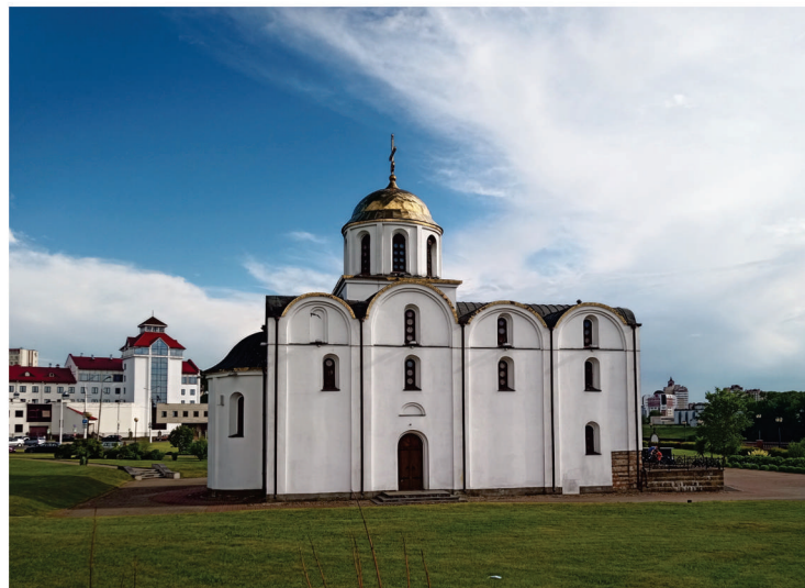
Благовещенская церковь в Витебске

Оскорбленный Мстислав не мог тут же дать волю гневу, но как только он решил дела в степи, то организовал военную кампанию против Полоцкой земли еще масштабнее той, что задумывал против половцев. Дружины из семи русских княжеств и орда союзных Мстиславу степняков-торков почти одновременно с юга, севера и востока пересекают межи Полоцкой земли. Один из главных организаторов и участников похода Всеволод Мстиславович ведет полки новгородцев на главный город княжества - Полоцк. Силы не равные. Какие-то города сопротивляются, какие-то сдаются почти сразу. Всеславичи схвачены, посажены в лады и как пленники сосланы в далекую Византию. В занятых городах воссели ставленники Мстислава.